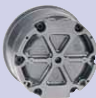
vue arrière du montage en saillie