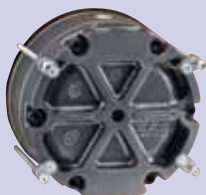
vue arrière du montage encastré